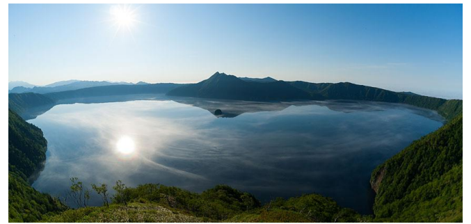
世界中から多くの観光客が訪れる摩周湖