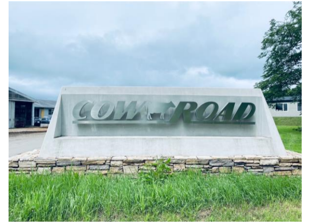
目印となる牧場入口の看板